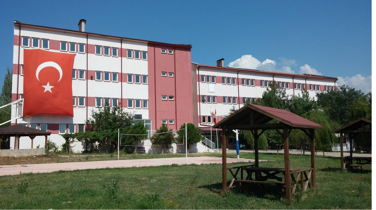
Resim-14 Gölpazarı Meslek Yüksekokulu

Dumlupınar Üniversitesinden ayrılarak Üniversitemize bağlanmış olup eğitim öğretim faaliyetlerini Gölpazarı ilçesinde bulunan toplam 1.200 m 2 kapalı alana sahip binada sürdürmektedir. Yüksekokul bünyesinde; Büro Yönetimi ve Yönetici Asistanlığı, Halkla İlişkiler ve Tanıtım, Muhasebe ve Vergi Uygulamaları, Pazarlama, Yerel Yönetimler ve Lojistik programları bulunmaktadır.