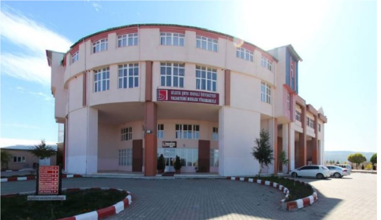
Resim-15 Pazaryeri Meslek Yüksekokulu

Dumlupınar Üniversitesinden ayrılarak Üniversitemize bağlanmış olup eğitim öğretim faaliyetlerini Pazaryeri ilçesinde bulunan 8.000 m 2 kapalı alana sahip binada sürdürmektedir. Yüksekokul bünyesinde; Bankacılık ve Sigortacılık, Bilgisayar Programcılığı, Çağrı Merkezi Hizmetleri, Doğal Yapı Taşları Teknolojisi, Endüstri Ürünleri Tasarımı, Kozmetik Teknolojisi, Muhasebe ve Vergi Uygulamaları, Organik Tarım, Tekstil Teknolojisi-Dokuma, Tekstil Teknolojisi-Terbiye, Tıbbi Tanıtım ve Pazarlama, Tıbbi ve Aromatik Bitkiler, Dış Ticaret, programları bulunmaktadır.