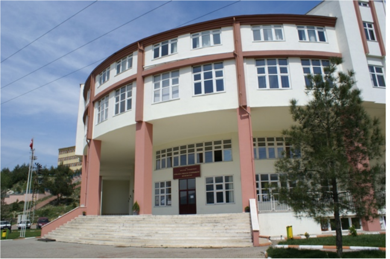
Resim-12 Osmaneli Meslek Yüksekokulu

Dumlupınar Üniversitesinden ayrılarak Üniversitemize bağlanmış olup eğitim öğretim faaliyetlerini Osmaneli ilçesinde bulunan toplam 2.014 m 2 kapalı alana sahip binada sürdürmektedir. Yüksekokul bünyesinde; Dış Ticaret, Elektrik, İklimlendirme ve Soğutma Teknolojisi, Makine, Muhasebe ve Vergi Uygulamaları, Sağlık Kurumları İşletmeciliği, Seracılık, Turizm ve Otel İşletmeciliği, Peyzaj ve Süs Bitkileri, Tıbbi Dokümantasyon ve Sekreterlik, Lojistik ile İşçi Sağlığı ve İş Güvenliği programları bulunmaktadır.