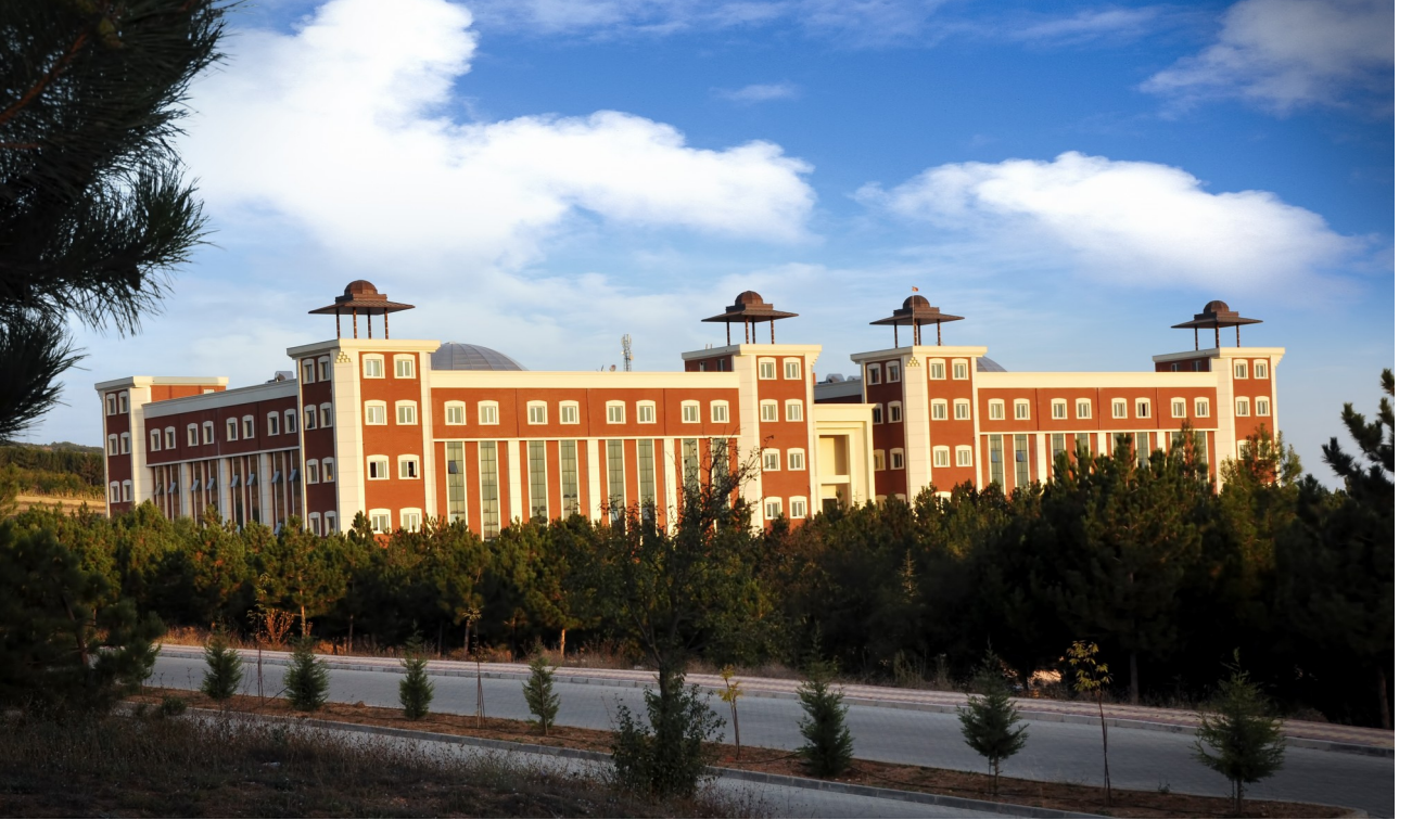
Resim-4 Mhendislik Fakltesi

2008 gz dneminden itibaren đrenci almaya bařlamıřtır. Eđitim đretim faaliyetlerini Glmbe Kampsndeki toplam 12.000 m 2 kapalı alana sahip modern binalarda srdrmektedir. Faklte bnyesinde; Makine ve İmalat Mhendisliđi, Kimya ve Sre Mhendisliđi, Bilgisayar Mhendisliđi, Elektrik-Elektronik Mhendisliđi, Metalurji ve Malzeme Mhendisliđi ile İnařaat Mhendisliđi programları bulunmaktadır.