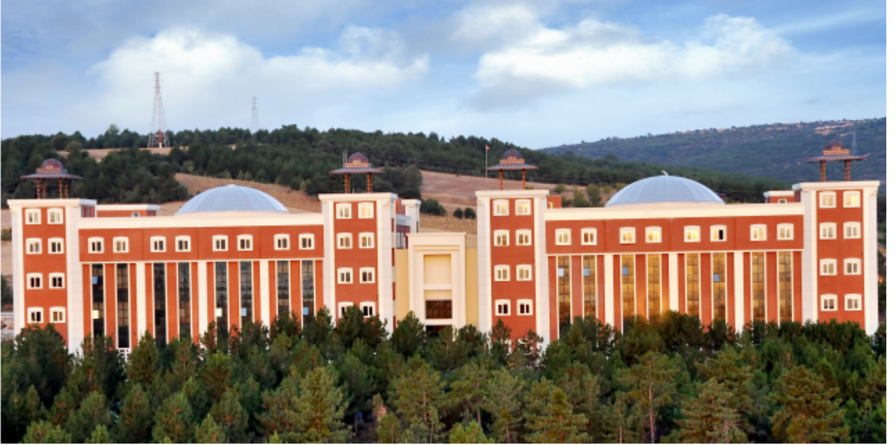
Resim-5 Fen-Edebiyat Fakltesi

2009 gz dneminden itibaren đrenci almaya bařlamıřtır. Eđitim đretim faaliyetlerini Glmbe Kampsndeki toplam 19.000 m 2 kapalı alana sahip modern binalarda srdrmektedir. Faklte bnyesinde; Kimya, Cođrafya, Matematik, Molekler Biyoloji ve Genetik, Tarih, Arkeoloji, Trk Dili ve Edebiyatı programları ile Felsefe, Fizik, Sosyoloji ve İstatistik blmleri bulunmaktadır.