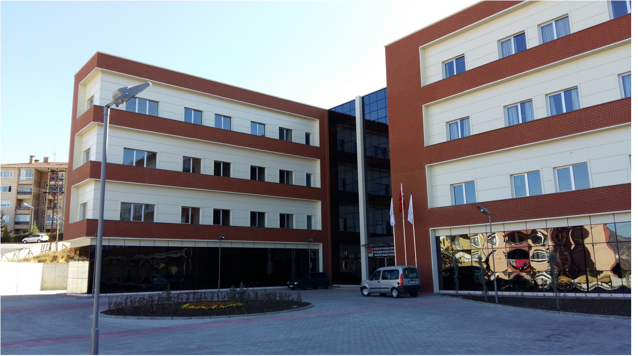
Resim-11 Bozüyük Meslek Yüksekokulu

Anadolu Üniversitesinden ayrılarak Üniversitemize bağlanmış olup, eğitim öğretim faaliyetlerini Bozüyük Kampüsündeki (Uygulamalı Bilimler Yüksekokulu ile birlikte) toplam 7.705 m 2 kapalı alana sahip modern binalarda sürdürmektedir. Yüksekokul bünyesinde; Seramik, Cam ve Çinicilik, Bankacılık ve Sigortacılık, Muhasebe ve Vergi Uygulamaları, Pazarlama, Dış Ticaret, Grafik Tasarımı, Çevre Koruma ve Kontrol, Maden, Ormanlık ve Orman Ürünleri ve Doğal Yapı Taşları Teknolojisi programları bulunmaktadır.