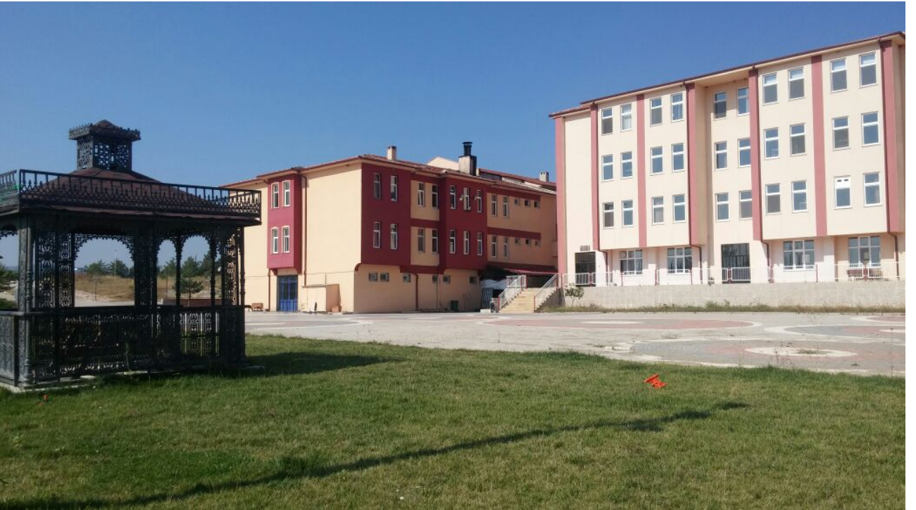
Resim-13 Söğüt Meslek Yüksekokulu

Dumlupınar Üniversitesinden ayrılarak Üniversitemize bağlanmış olup eğitim öğretim faaliyetlerini Söğüt ilçesinde bulunan 5.000 m 2 kapalı alana sahip binada sürdürmektedir. Yüksekokul bünyesinde; Basım ve Yayın Teknolojileri, Bilgisayar Programcılığı, Büro Yönetimi ve Yönetici Asistanlığı, Geleneksel El Sanatları, Moda Tasarımı, Muhasebe ve Vergi Uygulamaları, Seramik, Cam ve Çinicilik, Sosyal Güvenlik, Turizm Rehberliği, Mimari Dekoratif Sanatlar, Adalet, Halkla İlişkiler ve Tanıtım, İç Mekan Tasarımı ile Turizm ve Otel İşletmeciliği programları bulunmaktadır.