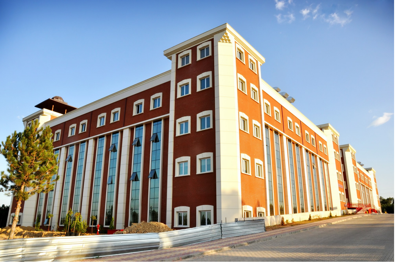
Resim-6 İktisadi ve İdari Bilimler Fakültesi

Dumlupınar Üniversitesinden ayrılarak Üniversitemize bağlanmış olup eğitim öğretim faaliyetlerini Gülümbe Kampüsündeki toplam 19.000 m 2 (Sağlık Yüksekokulu ve Sağlık Hizmetleri Meslek Yüksekokulu ile birlikte) kapalı alana sahip modern binalarda sürdürmektedir. Fakülte bünyesinde; İktisat, İşletme, Maliye, Siyaset Bilimi ve Kamu Yönetimi, Yönetim Bilişim Sistemleri programları ile Uluslararası İlişkiler bölümü bulunmaktadır.