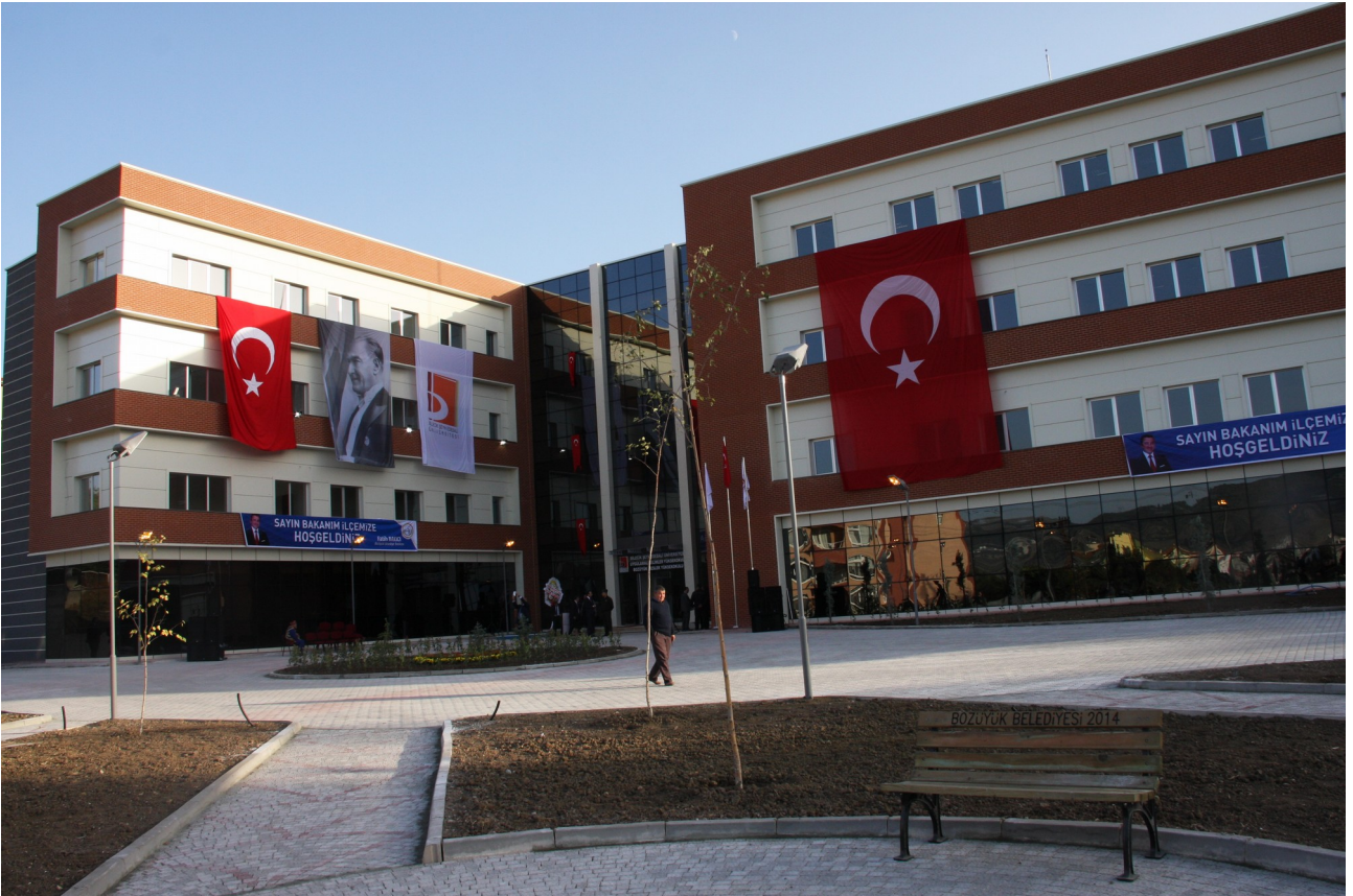
Resim-8 Uygulamalı Bilimler Yksekokulu

2014 gz dneminden itibaren đrenci almaya bařlamıřtır. Eđitim đretim faaliyetlerini Bozyk Kampsndeki (Bozyk Meslek Yksekokulu ile birlikte) toplam 7.705 m 2 kapalı alana sahip modern binalarda srdrmektedir. Yksekokul bnyesinde; Bankacılık ve Finans, Muhasebe ve Denetim, Turizm İřletmeciliđi ve Otelcilik programları ile Ynetim Biliřim Sistemleri blm bulunmaktadır.