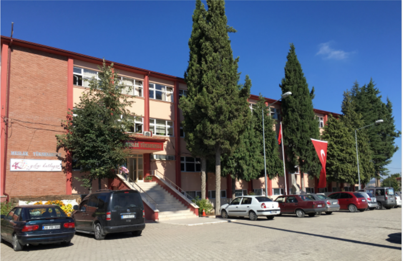
Resim-10 Meslek Yüksekokulu

Anadolu Üniversitesinden ayrılarak Üniversitemize bağlanmış olup eğitim öğretim faaliyetlerini Gülümbe Kampüsünde bulunan toplam 2.337 m 2 kapalı alana sahip binada sürdürmektedir. Yüksekokul bünyesinde; Bilgisayar Programcılığı, Elektrik, Elektrik Enerjisi Üretim, İletim ve Dağıtım, Elektronik Haberleşme Teknolojisi, Elektronik Teknolojisi, Gıda Teknolojisi, İnşaat Teknolojisi, Kimya Teknolojisi, Kontrol ve Otomasyon Teknolojisi, Makine, Döküm, Metalurji, Otomotiv Teknolojisi, Peyzaj ve Süs Bitkileri, Tarım Makineleri, Üretimde Kalite Kontrol, Biyomedikal Cihaz Teknolojisi, Alternatif Enerji Kaynakları Teknolojisi, Ormancılık ve Orman Ürünleri, Çevre Koruma ve Kontrol, Çocuk Gelişimi programları bulunmaktadır.