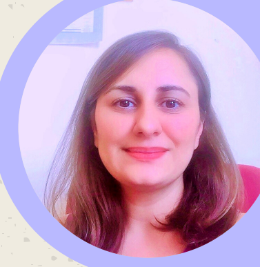
Çocuklarda Port Katater Ekstravazasyonu Arş.Gör. Remziye Semerci Trakya Üniversitesi Sağlık Bilimleri Fakültesi